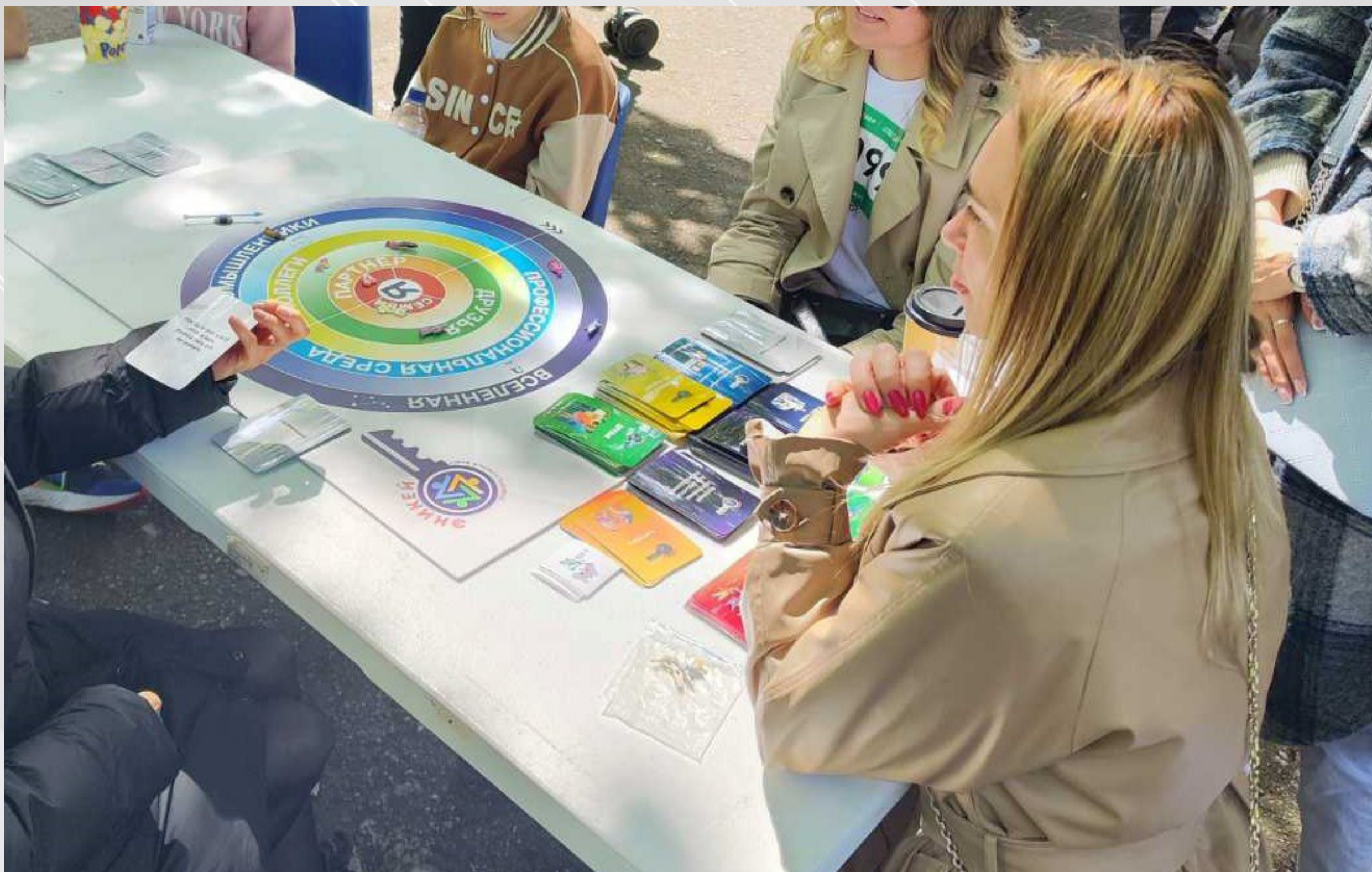
Участие в «Зелёный марафон», организованным ПАО Сбербанк.