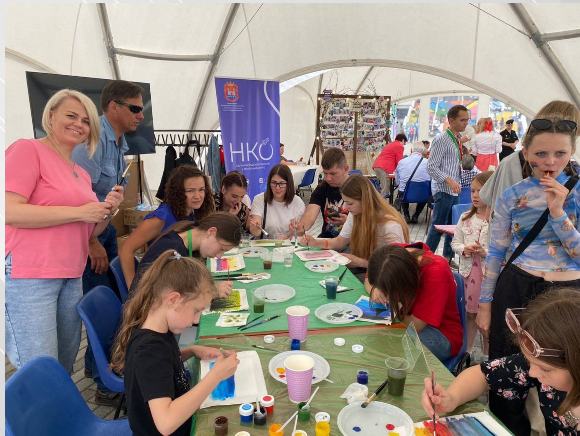
Участие в ежегодном фестивале «Добрый город Калининград»